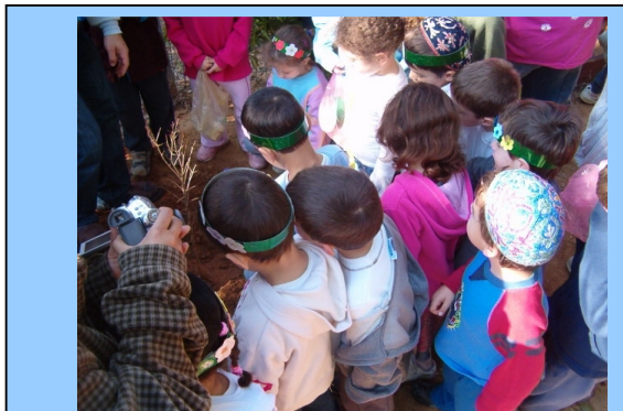
נטיעת עץ רימון בחצר גן קשת, עם ילדי כיתה א'