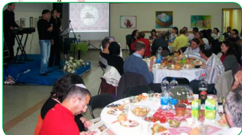
סדר ט"ו בשבט קהילתי למבוגרים, בהשתתפות מאה וארבעים חברי קהילה ואורחים