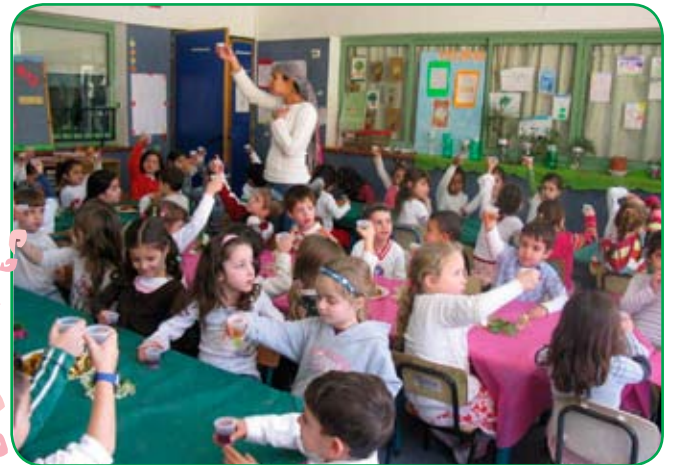
ט"ו בשבט בגני קשת