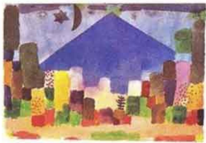
הר הניסן, פול קלה